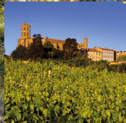
Montréal de l'Aude