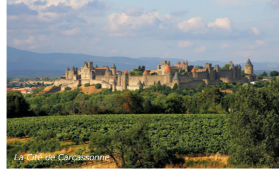
La Cité de Carcassonne