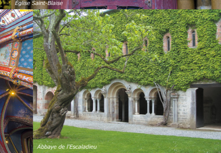
Abbaye de l'Escaladieu