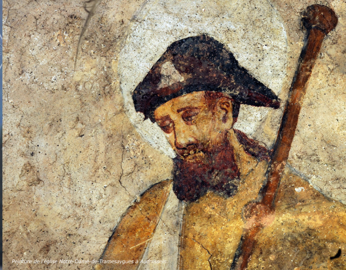
Peinture de l'église Notre-Dame-de-Tramesaygues à Audressein