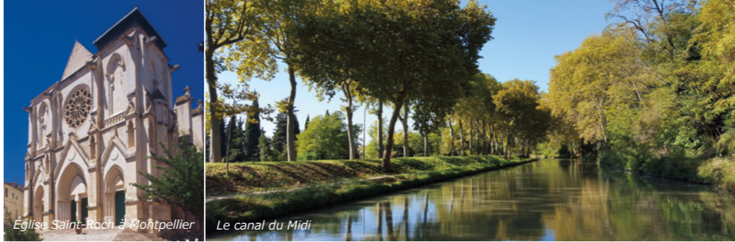
Église Saint-Roch à Montpellier