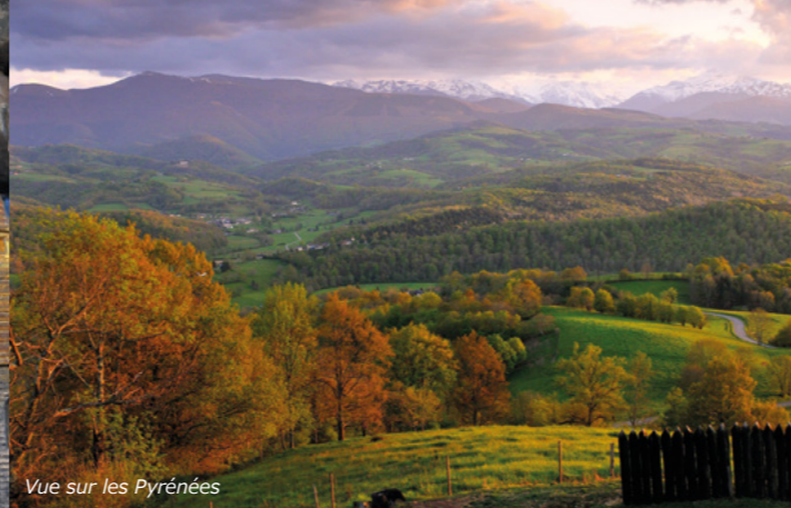
Vue sur les Pyrénées