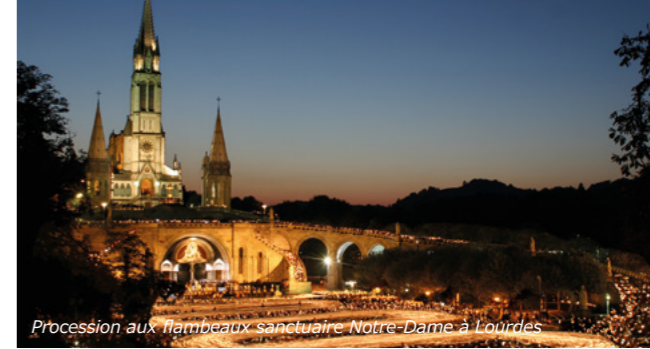
Procession aux flambeaux sanctuaire Notre-Dame à Lourdes