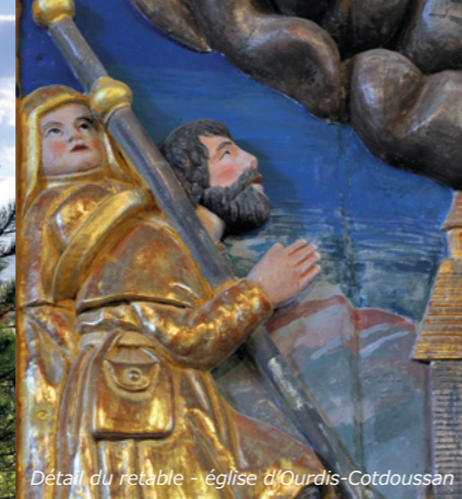
Détail du retable - église d'Ourdis-Cotdoussan